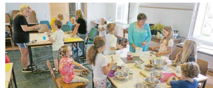
Die kreativen Workshops für Kinder und Jugendlichen fanden heuer erstmals im Hengist-Haus in Weitendorf statt.

Beim Hengist-Jubiläumsfest wurde den vier „Gründungsbürgermeistern“ die Ehrenurkunden überreicht.