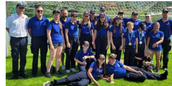
Die Bewerbungsgruppe der FF Neudorf/W. zusammen mit den Jugendlichen aus Wildon und Lang beim Jugendleistungsbewerb in Bad Schwanberg.

Die FF Neudorf ob Wildon ist stolz auf ihre Jugend und sieht in ihr eine vielversprechende Zukunft.