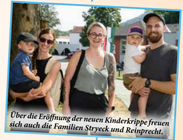
Über die Eröffnung der neuen Kinderkrippe freuen sich auch die Familien Stryeck und Reinprecht.