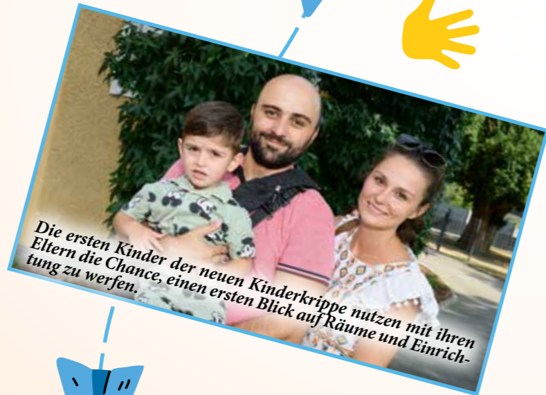
Die ersten Kinder der neuen Kinderkrippe nutzen mit ihren Eltern die Chance, einen ersten Blick auf Räume und Einrichtung zu werfen.