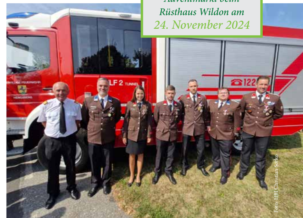
Die Wildoner Florianis tragen die erhaltene Auszeichnung mit Stolz