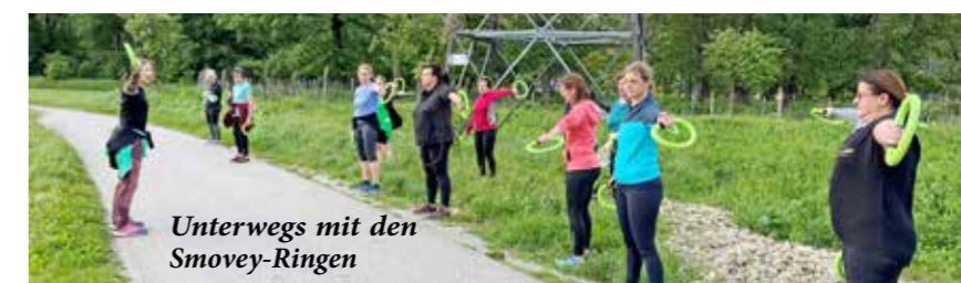
Unterwegs mit den Smovey-Ringen