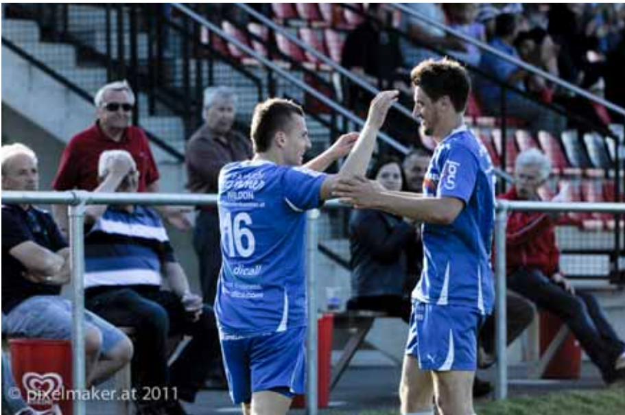
SV Wildon gegen Kapfenberg

Ein Sport-Fest der Superlative steht in Wildon am 18. und 19. Juni 2011 auf dem Programm.