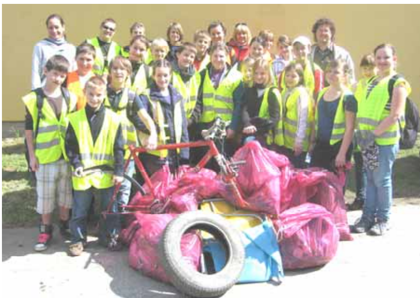
Frühjahrsputz in Wildon