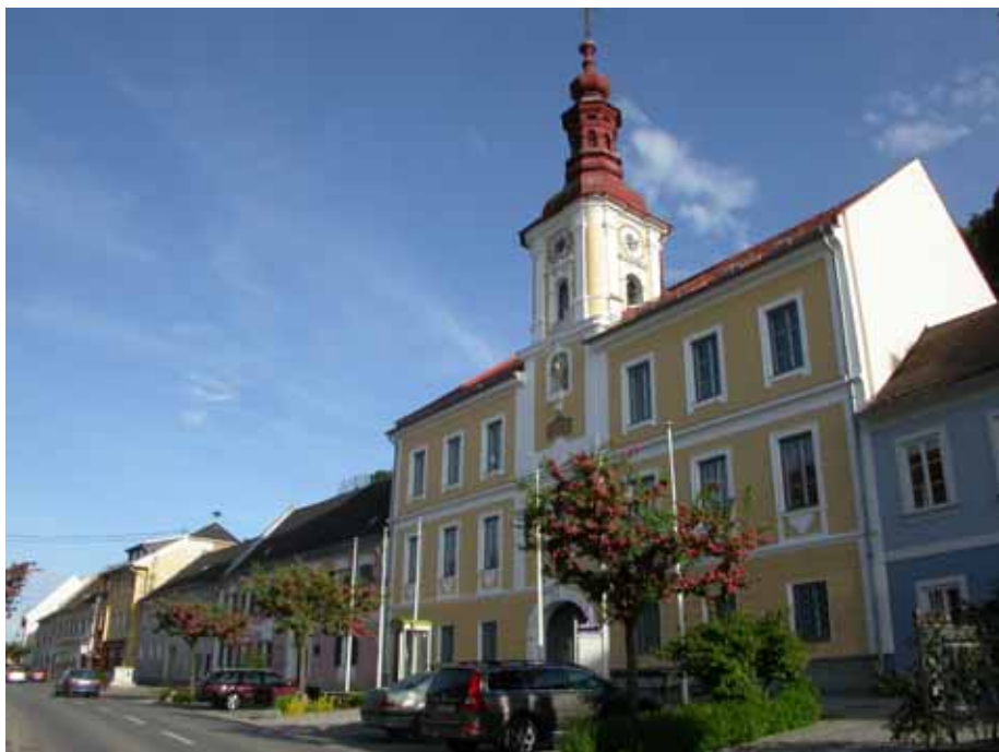
Betreutes Wohnen im „Alten Rathaus“, Hauptplatz 47, Wildon