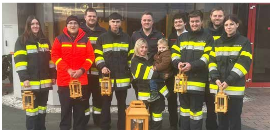
Die Feuerwehrjugend bei der alljährlichen Friedenslichtaktion

Am 24. Dezember hat die Feuerwehrjugend Neudorf ob Wildon in gewohnter Art und Weise das Friedenslicht im gesamten Dorf verteilt. Diese festliche Aktion sorgte nicht nur für strahlende Gesichter, sondern auch für eine weihnachtliche Atmosphäre. Wir möchten uns herzlich bei der Bevölkerung für die offenen Türen bedanken!