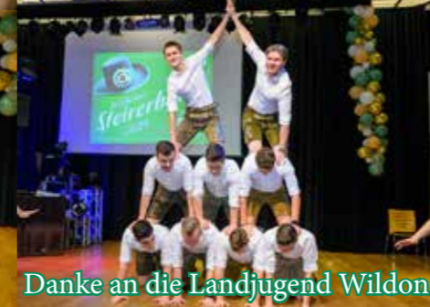
Danke an die Landjugend Wildon