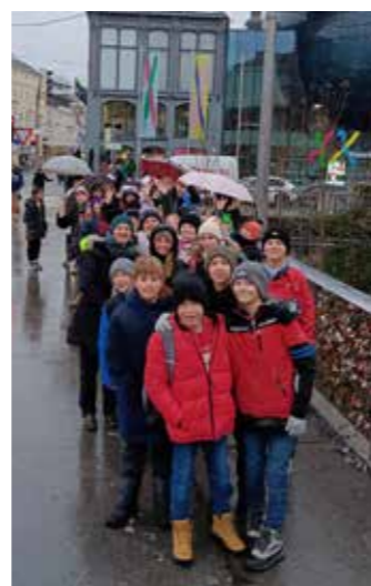
Die 1a und 1b beim Adventausflug vor dem Kunsthaus