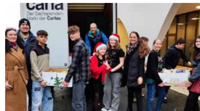
Kinder helfen beim Beladen des Carla LKWs: