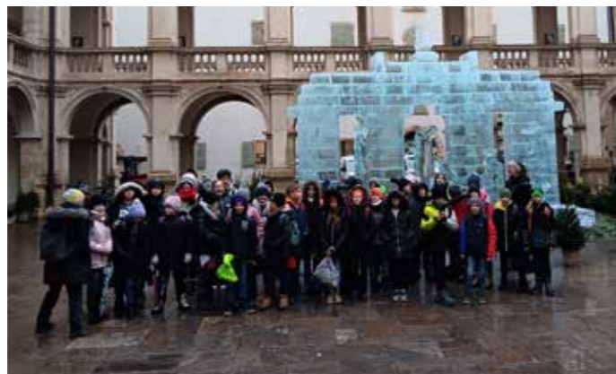
Die 1a und 1b bei der Eiskrippe