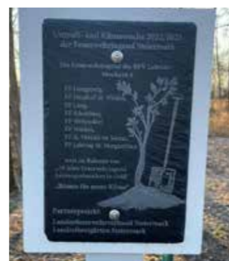
Am Mur-Radweg erinnert eine Tafel an die Umweltschutzaktion der Feuerwehrjugend