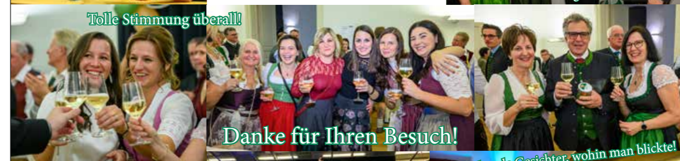
Tolle Stimmung überall!