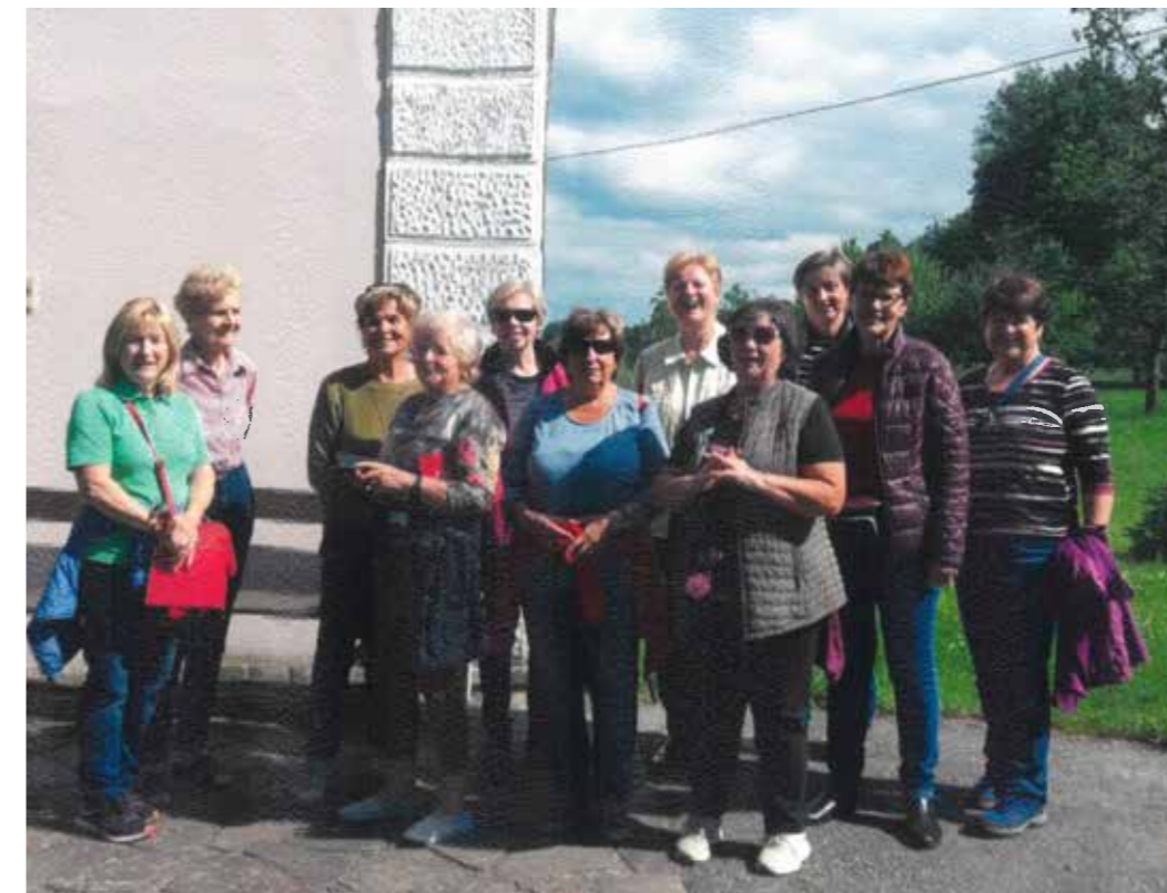
Der Kneipp Aktiv-Club beim Nullerhaus, wo Karl Morre 1884 das Volksstück „s Nullerl“ schrieb.