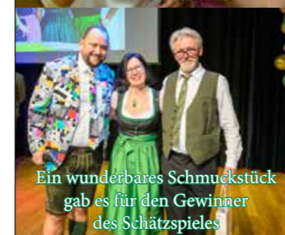
Ein wunderbares Schmuckstück gab es für den Gewinner des Schätzspiels