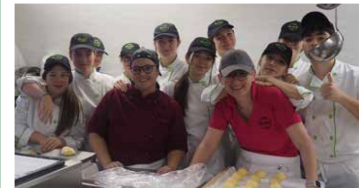
Dir. Roswitha Walch

wurde von den Fachschülern auf eindrucksvolle Weise präsentiert. Als besondere Stärkung konnten die Besucher frische Faschingskrapfen mit nach Hause nehmen.