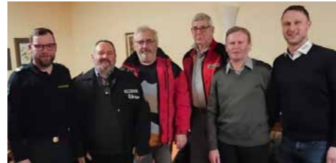
Die neu gewählte Einsatzleitung der OESt. der Stmk. Berg- und Naturwacht Lebring

Werde auch du ein Organ der Berg- und Naturwacht - es würde uns gefallen, wenn