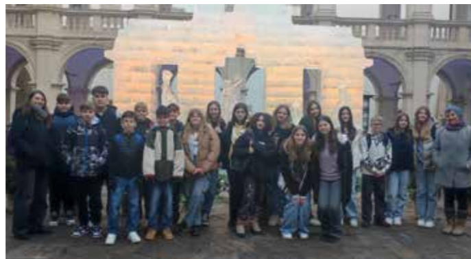
Die 3a bei der Eiskrippe