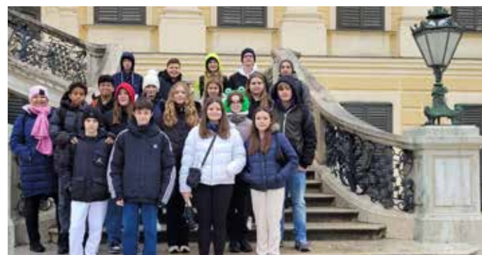
4b-Klasse der Mittelschule Wildon vor dem Schloss Schönbrunn