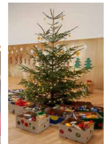
Spenden, die auf Abholung warten