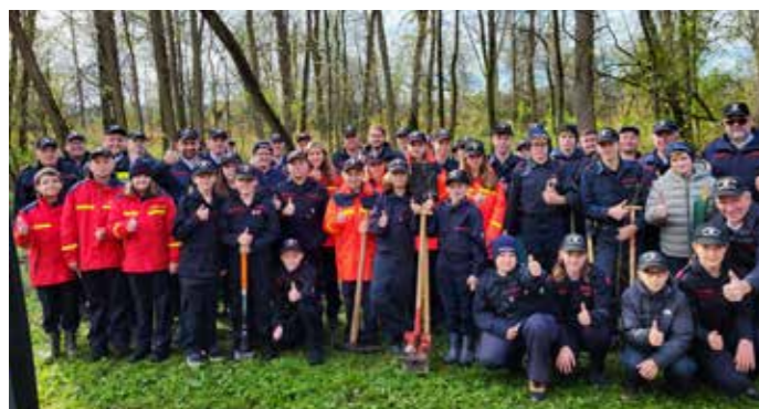
Die Feuerwehrjugend des Abschnittes 8 im Bereichsfeuerwehrverband Leibnitz