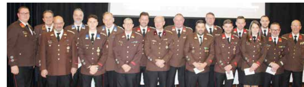
Das Kommando dankt dem Ausschuss für die geleistete Arbeit im vergangenen Jahr

Personen in Not zu helfen, Brände löschen oder Schäden nach heftigen Unwettern zu beseitigen. Über 100-mal ertönten in Wildon die Sirenen und riefen die Kameradinnen und Kameraden zum Einsatz. Davon wurde zu 29 Brandeinsätzen und 82 technischen Hilfeleistungen alarmiert. Der Sommer im Jahr 2023 war wieder einmal mehr ein Sommer der Extreme. Besonders stark getroffen von Überschwemmungen und Hangrutschungen hat es den Ortsteil Wurzing. Zu Überflutungen, Verkläuerungen und Reinigung von Verkehrswegen mussten die Einsatzkräfte mehrmals ausrücken. Insgesamt wurden von den Wildoner Florianis mehr als 14.000 Stunden ehrenamtlich für den Dienst am Nächsten geleistet.