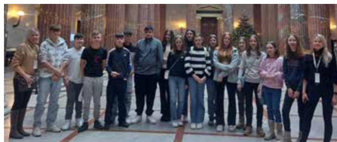
4a-Klasse der Mittelschule Wildon in der Säulenhalle im Parlament

Das Programm der nächsten Woche war vor- und nachmittags sehr abwechslungsreich. Es wurden die bekanntesten Sehenswürdigkeiten der Stadt,