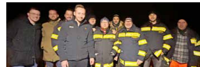
Die Abordnung der FF Wildon als erste Gratulanten zum 30er.